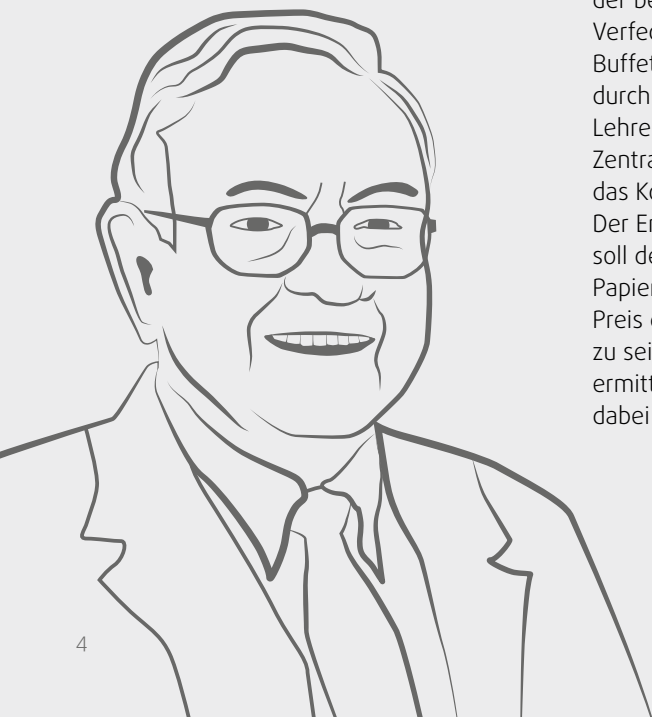
Warren E. Buffett US-amerikanischer Großinvestor

Mit der Beteiligungsgesellschaft Berkshire Hathaway erzielte Warren Buffet von 1965–2016 eine Durchschnittsrendite von 20,8% p.a..